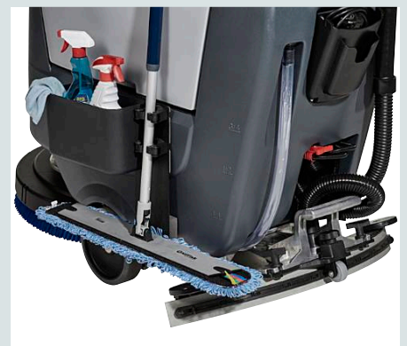
Boîte de rangement avec porte-manche intégré (en option).