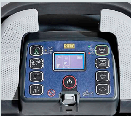
Un tableau de bord à affichage numérique, boutons intuitifs avec icône et commandes ergonomiques