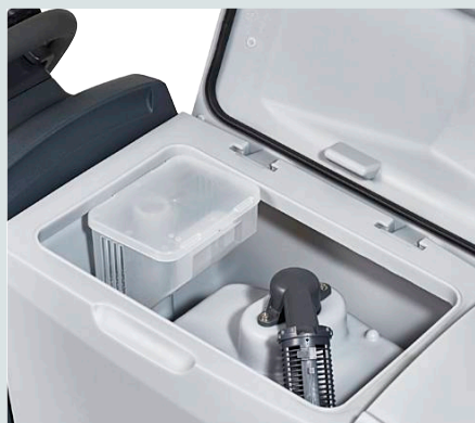
Productivité : réservoir d'eau et de récupération de 45 litres chacun, faible consommation d'énergie offrant jusqu'à 5 heures d'autonomie