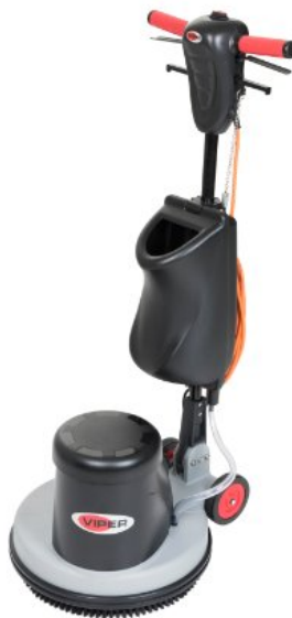
De getoonde afbeelding kan afwijken van het gekozen type

Eenvoudig te gebruiken en efficiënte duospeed eenschijfsmachine. De VIPER DS350 duospeed eenschijfsmachine is de ideale oplossing voor het schrobben van harde vloeren.