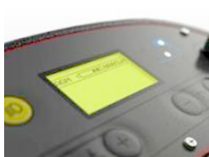
LCD display inclusief urenteller