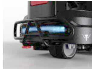
Stevige bumper met goed zichtbare verlichting